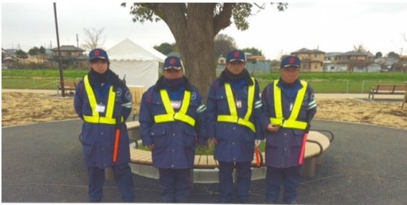
かがり火公園開園記念式典 ～大落古利根川 川のまるごと再生プロジェクト～